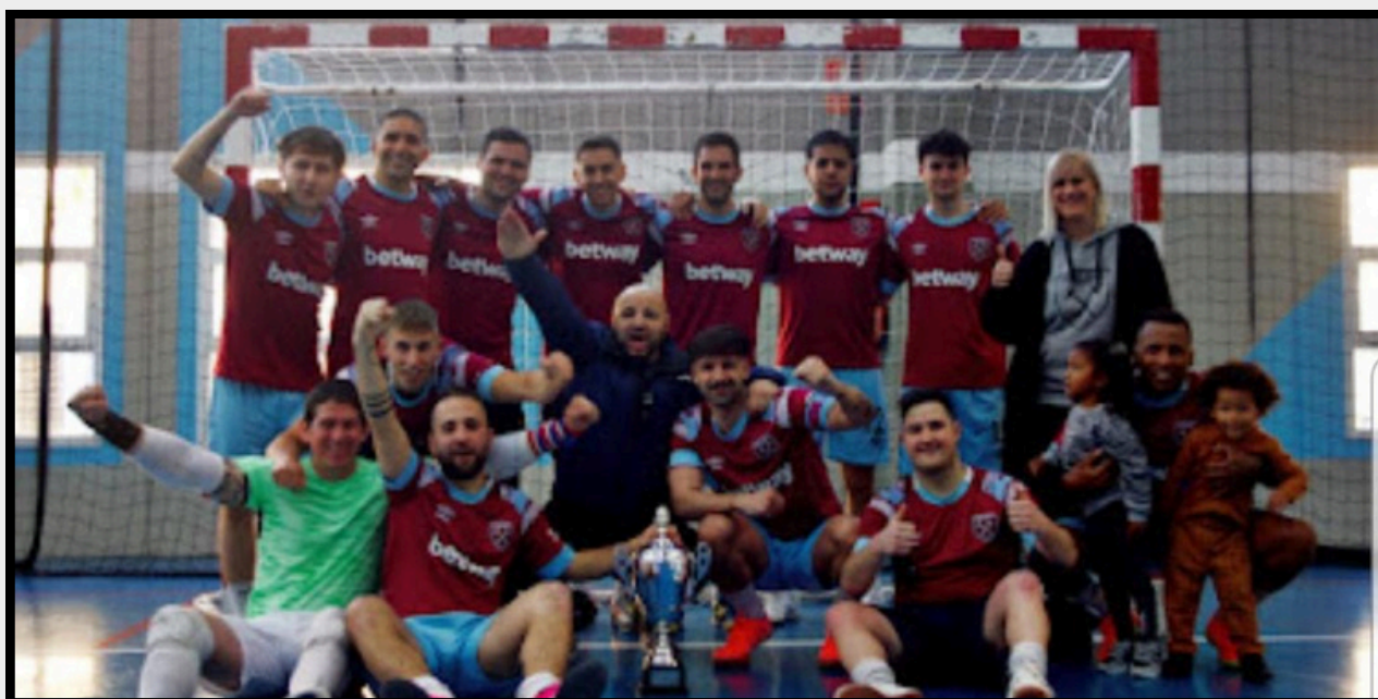
West Ham FS campeón LDFS 23/24

Nuestros mejores clubes pueden participar en campeonatos nacionales de fútbol Sala organizados por la Confederación Nacional de Fútbol Sala (CNFS), entidad española reconocida a nivel internacional.